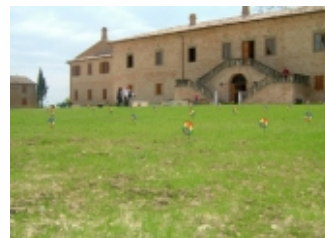
MUSEO DEL BALI'

Ore 20.00 - 22.00: cena e diario di bordo.