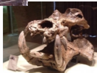
I FOSSILI NEL MUSEO

L'associazione fa presente che gli orari delle attività giornaliere sono indicativi e possono variare a seconda delle esigenze del gruppo, delle condizioni meteorologiche e di come vengono selezionate le attività didattiche da svolgere per realizzare il campo scuola.