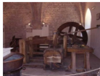
MUSEO DELLA CARTA FABRIANO

Visita Didattica al Museo della carta e della filigrana di Fabriano. L'attività della durata di 1 ora e 15' circa, avviene con l'assistenza di esperti. Il programma include una dimostrazione pratica dal vivo della produzione della carta a mano, effettuata dai Mastri cartai del Museo, la visione di filigrane antiche, dal XIII secolo ad oggi, e di un filmato sulla storia della carta a Fabriano.