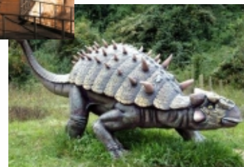
PARCO DEI DINOSAURI