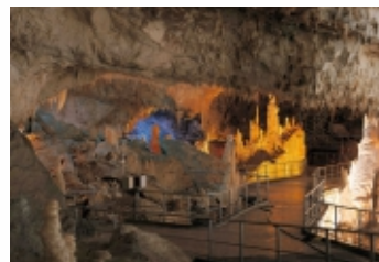
GROTTE DI FRASASSI

Ore 20.00 - 22.00: cena e diario di bordo