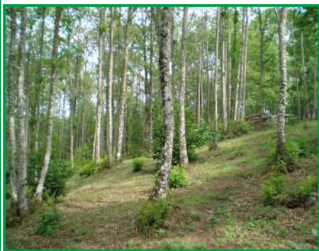
BOSCHETTO A CASTAGNO