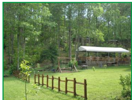
AREA GIOCO E RELAX