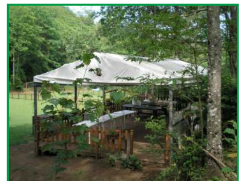
AREA PER I LABORATORI e per il ricovero in caso di pioggia improvvisa